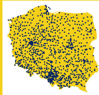
UŻYTKOWNICY "FIZYKI DLA SZKÓŁ WYŻSZYCH" WG LOKALIZACJI (2020)

W grudniu 2020 r. opublikowaliśmy PSYCHOLOGIĘ . Podręcznik powstał w ścisłej współpracy z 25 dydaktykami i praktykami. Pozycja liczy ponad 700 stron i zawiera 500 zadań.